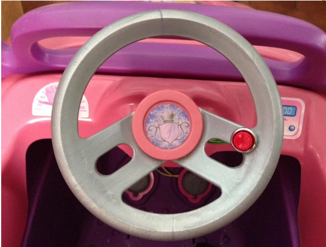
Detalle del coche adaptado con pulsador en volante.