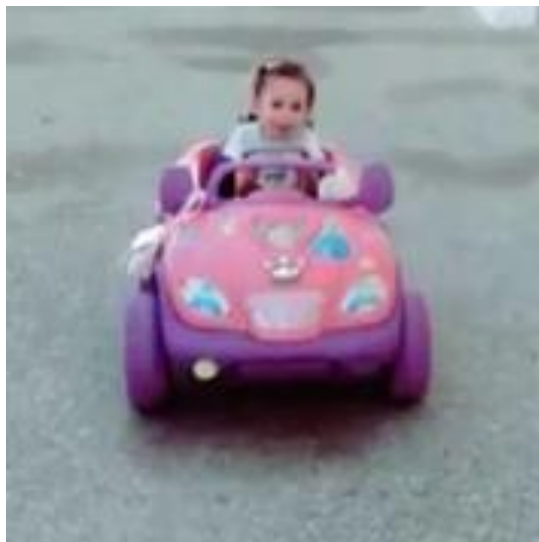
Juguete adaptado en uso.