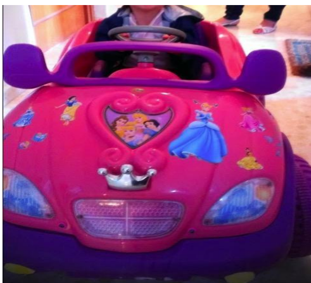
Juguete adaptado en uso.