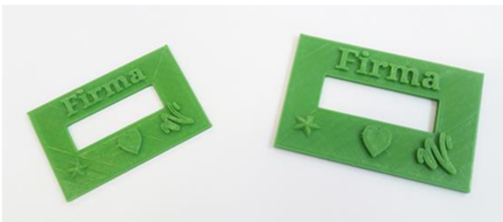
Imagen 4. Plantillas de firmas.