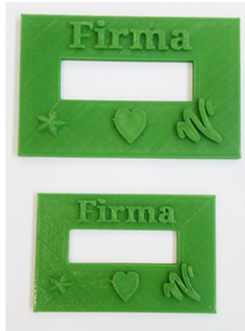
Imagen 1: Plantillas de firmas. Distintos tamaños.